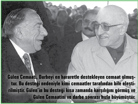
Gülen Cemaati, Darbeyi en hararetle destekleyen cemaat olmuştur. Bu desteği nedeniyle kimi cemaatler tarafından bile eleştirilmiştir. Gülen'in bu desteği kısa zamanda karşılığını görmüş ve Gülen Cemaatini ve darbe sonrası hızla büyümüştür.

Aydınlar Ocağı çevresi 12 Eylül'e destek olurken, 12 Eylül Cuntası da Aydınlar Ocağı'nın fikirlerinin yaşama geçirilmesi için büyük bir çaba vermiştir.