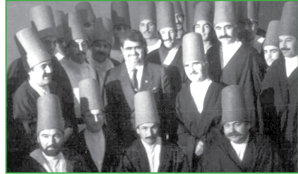
Türkiye siyasetinde dini ve muhafazakarlığı popülarize edip kentileştiren isim, Turgut Özal olmuştur. Özal'ın Nakşibendi tarikatıyla güçlü bağları olduğu basına da yansımıştır.

Darbeyi destekledikçe büyüyen, darbenin desteğiyle yükselen cemaatler, Özal döneminde de yükselişlerini devam ettirmişlerdir. Türk İslam Sentezi ideolojisi etrafında şekillendirilen kültürel ve siyasal ortam, toplumun gerici ve tutucu bir yapıya bürünmesinde büyük rol